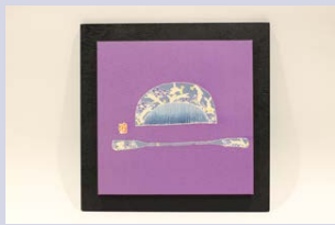
戸出 亜子 【加賀友禅】