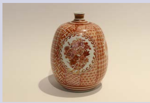
南 恵子 【赤絵】