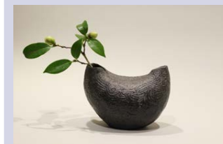
宮脇 まゆみ 【珠洲焼】