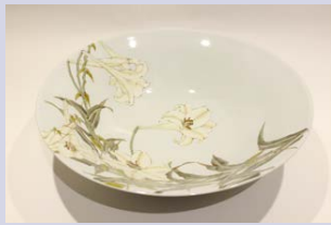
柴田 有希佳 【九谷焼】