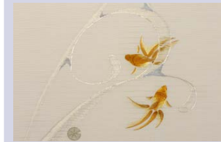
高田 千春 【加賀繡】